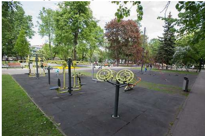
Pargis saab harrastada väga erinevaid tegevusi, aga kõiki enam-vähem samas kohas.

Avalik ruum ei ole pelgalt ühest kohast teise jõudmiseks. See peab