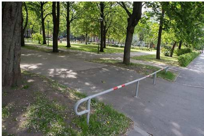
Torupiire sobib nii autojuhi kui ka jalgratturi tõrjumiseks.

Torupiirded nii Politseiaias kui ka mujal linnas ei takista inimesi, sest kes tahab otse minna, läheb niikuinii, ning pealegi kujutavad torupiirded ohtu autoga liiklejatele. Nende paigaldamise asemel tuleks analüüsida, miks inimesed kasutavad just neid kohti – kas on ehk hoopis otstarbekam teha mõni uus ülekäigurada, nii nagu ka pargiteede rajamisel võeti arvesse rohu sisse tallatud teid. Juhul kui piire pannakse jalakäija kaitsmiseks sõidutee ohtude eest, tuleks pigem kaaluda alternatiivseid ja visuaalselt paremaid lahendusi. Pronksi tänava äärde istutatud hekk ja peidetud võrkaed teevad oma tööd paremini kui torupiirded.