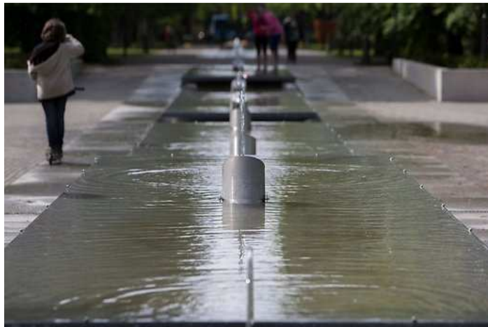
Uue pusrkkaevu veejugasid saab sättida nagu morset.