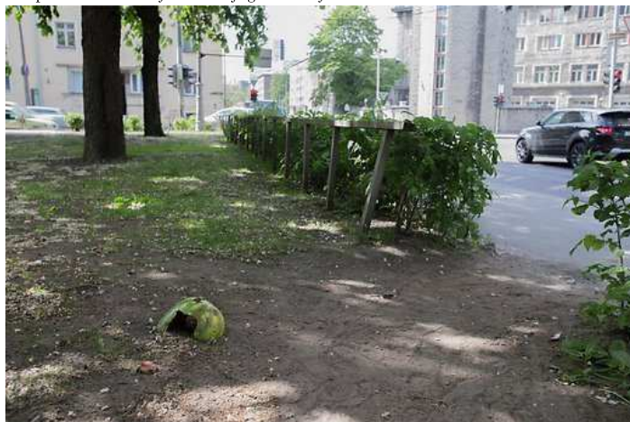
Pargi servas ei paista ümberehitusest jälgegi.

Pargi infotahvli joonis näeb välja väga kena ja loogiline, kuid pargis olles on avanevad vaated ja kogemused paraku teised. Arhitektid ja planeerijad võivad olla linnaruumi loomisel funktsionäärid ja ideoloogid, kuid nende skeemid ja joonised, nende planeeritud hooned ja ruum ei tekita iseenesest linnaruumi.