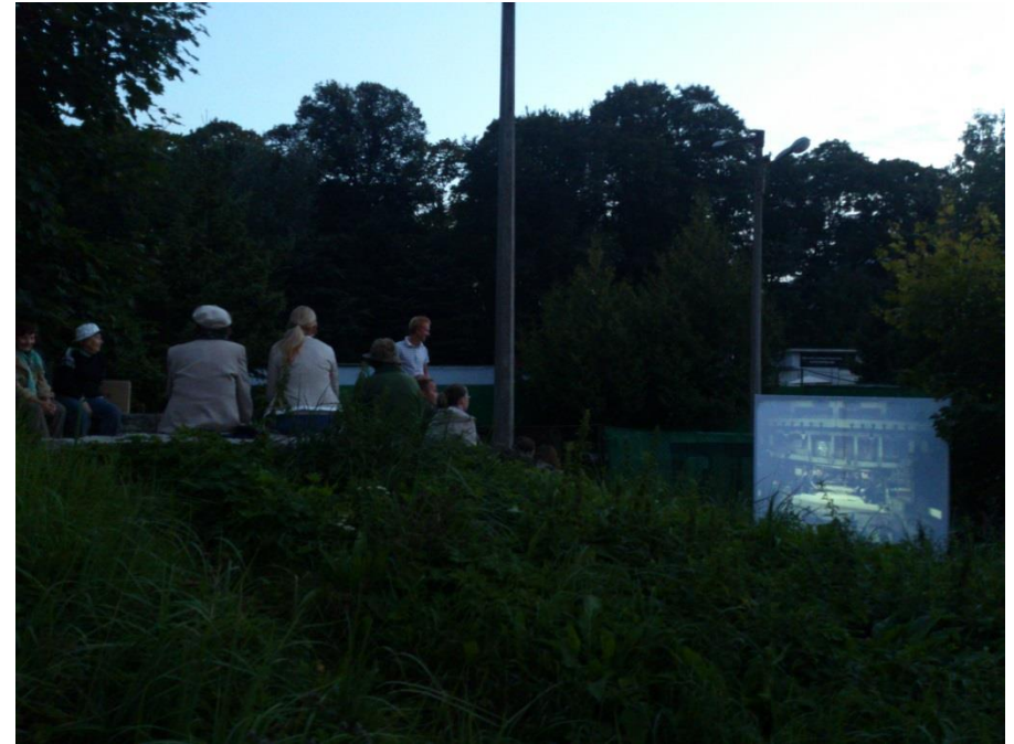
Väliruumi mitmekesine kasutamine välükino Poolamäel Juhkentali asumis, aug 2013, Tallinn