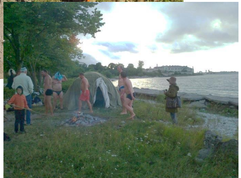
Ruumi vahakasutamine avalik rannapidu Kalarannas, juuni 2011