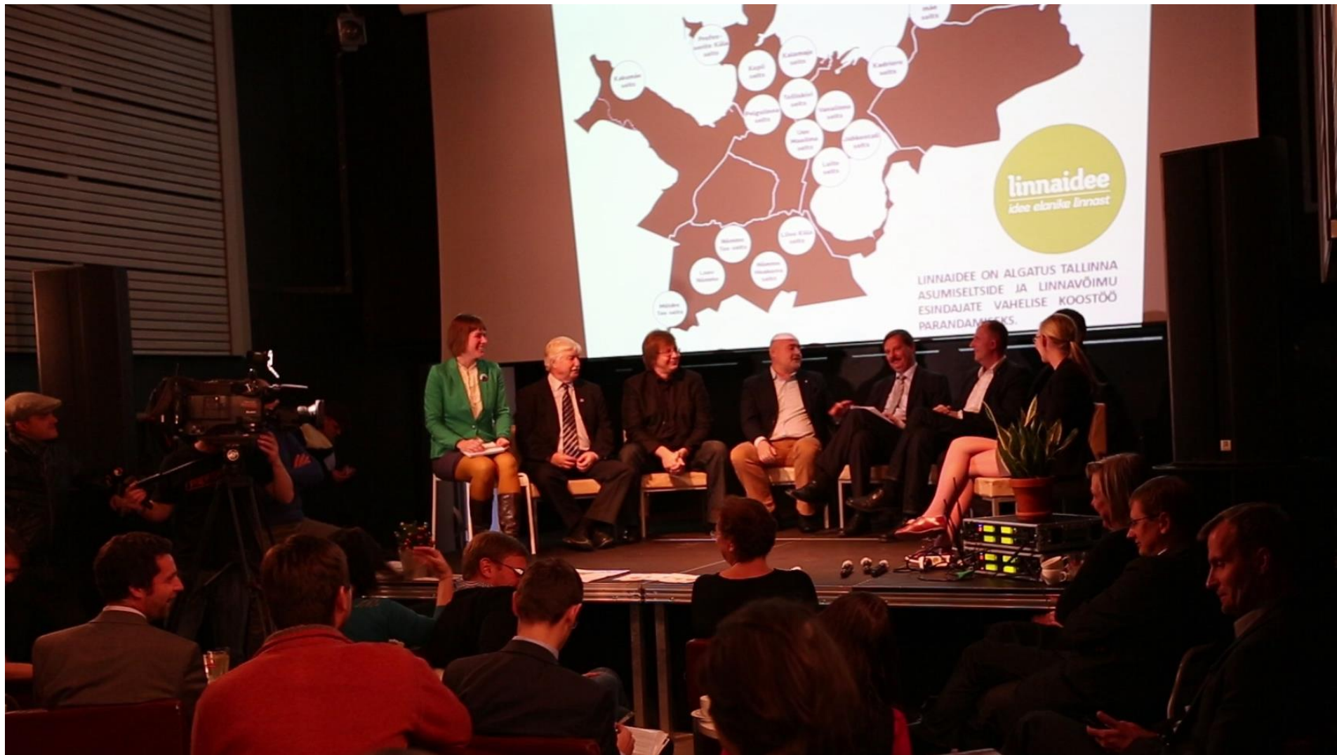
Linnapeakandidaatide debatt hea koostöö üle 12. oktoobril 2013