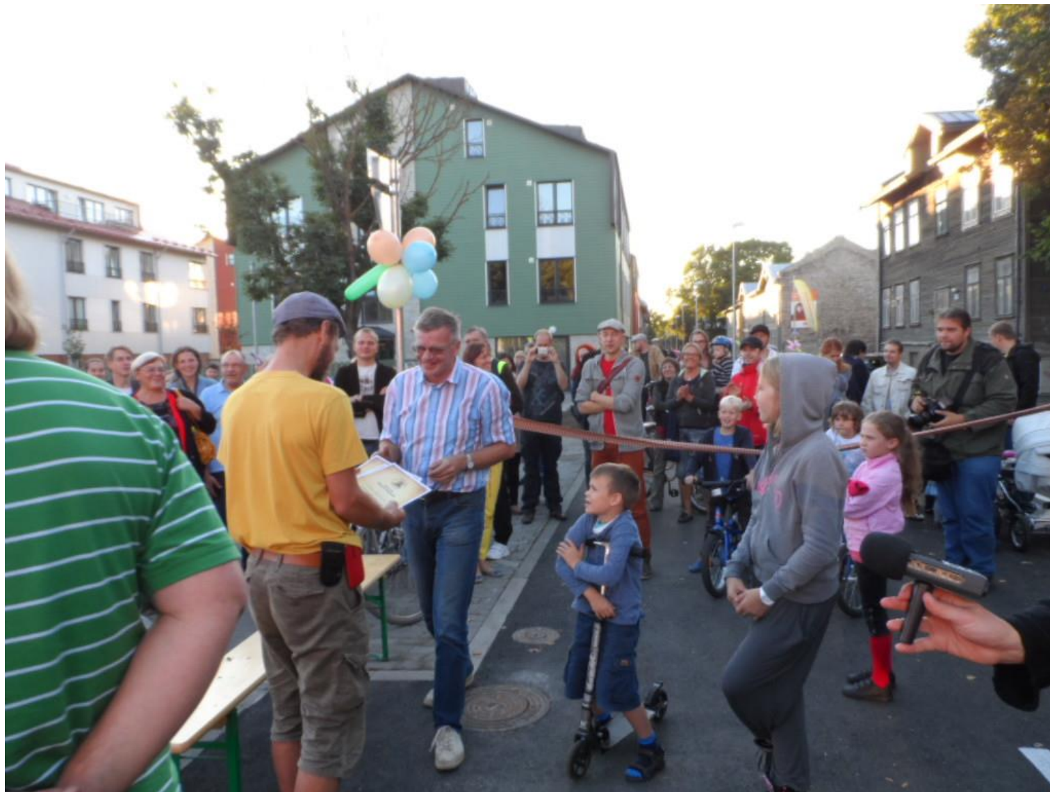
Soo tänava avamine 4.09.2013 Kalamajas Tallinnas