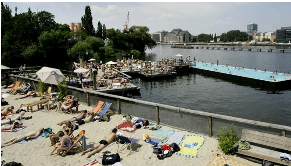
Suvi keset linna (Berliin) 7