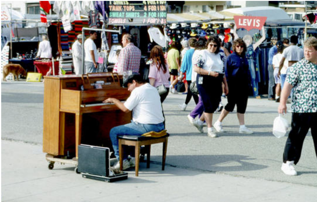
Kohti loovad väikesed asjad (Venice Beach, CA) 8

Kohalooma üks aluspõhimõtte on hinnata värske pilguga igapäevaelu (ruumi)kogemusi, korraldust ja seaduspärasusi. Kohalooma filosoofia juhindub arusaamast, et kui inimesed tulevad kokku, on võimalikud ka suured, avalikke hüvesid loovad muutused.