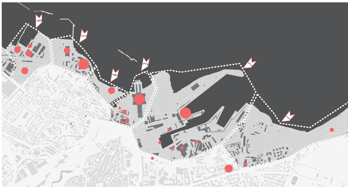
Konkursiala tinglikud piirkonnad

Konkursiala on vaikimisi jaotatud kuueks piirkonnaks, et pärast konkursi lõppu lihtsustada esitatud ideede töötlemist ja tekitada piirkondlikud minivisioonid. Vaikimisi piirkonnad on 1) Russalkast vanasadamani 2) vanasadam (sh Admiraliteedi bassein ja kruisisadam), 3) Linnahall-Kultuurikatel-kalaturg 4) Kalasadam ja Kalarand 5) Patarei ja lennusadam 6) Noblessner ja kalmistupark.