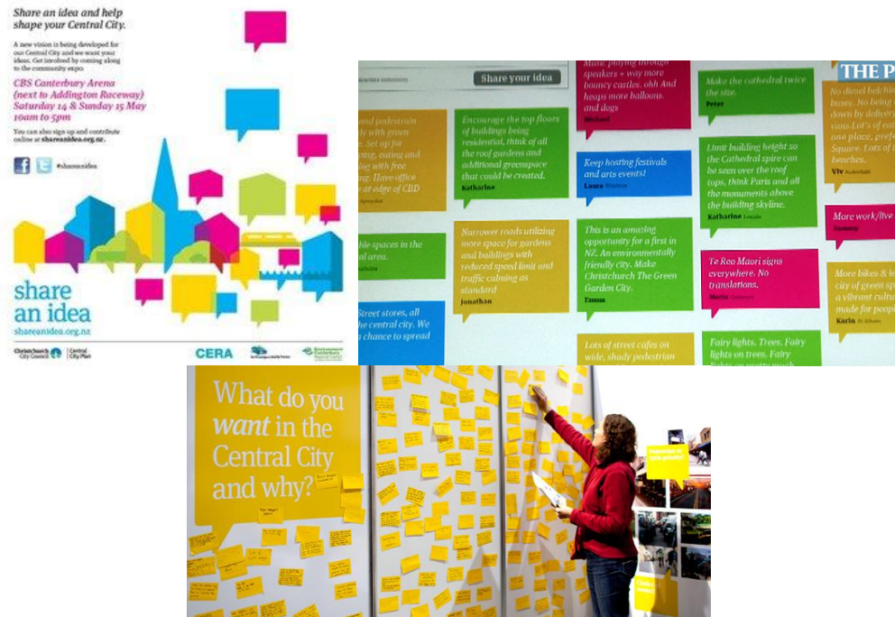
Share an Idea osaluskaupia Christchurchis Uus-Meremaal 3