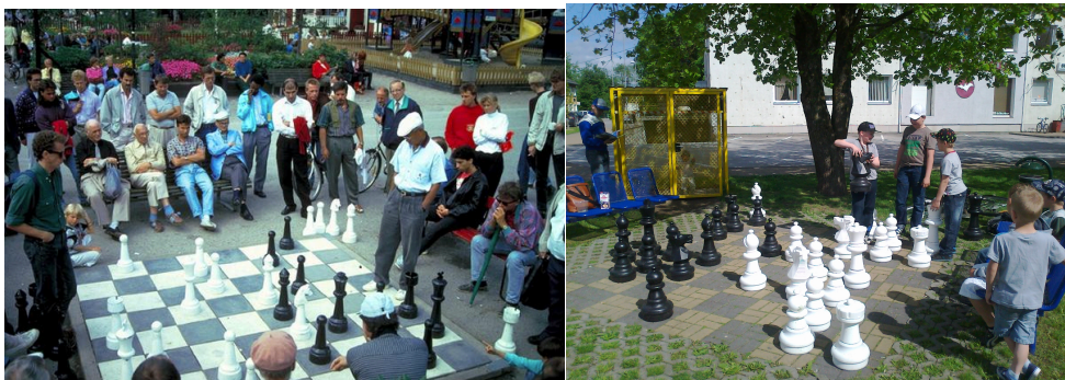
Põnevust erinevatele generatsioonidele (vasakul Stockholm, paremal Jõgeva) 11