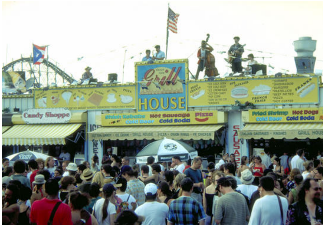
Milliseks võiks tulevikus kujuneda Tallinna kesklinna mereääre identiteet? (Coney Island, New York) 9

Vaata lisa: http://www.pps.org/reference/reference-categories/placemaking-tools/