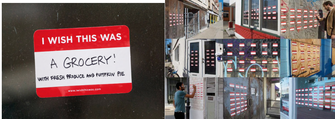
I Wish This Was kleepsud 5