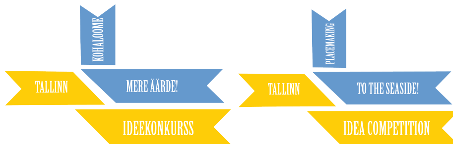
Üks võimalik logovariant

Konkursile on vaja leida tabav nimi ning see konkursi logoga siduda. Logo peab olema lihtne ja kasutatav kõigis reklaammaterjalides, et kinnistuks sihtrühmade seas ja seostuks alati mereääre aktiivsema kasutusega.