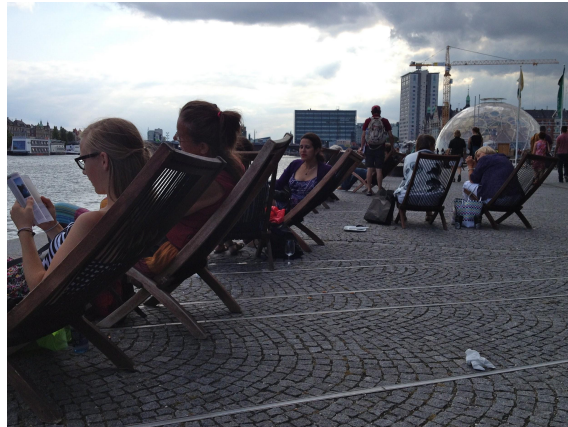
Mõnus koht, kus jalga puhata nii turistile kui ka kohalikule (Kopenhaagen) 10