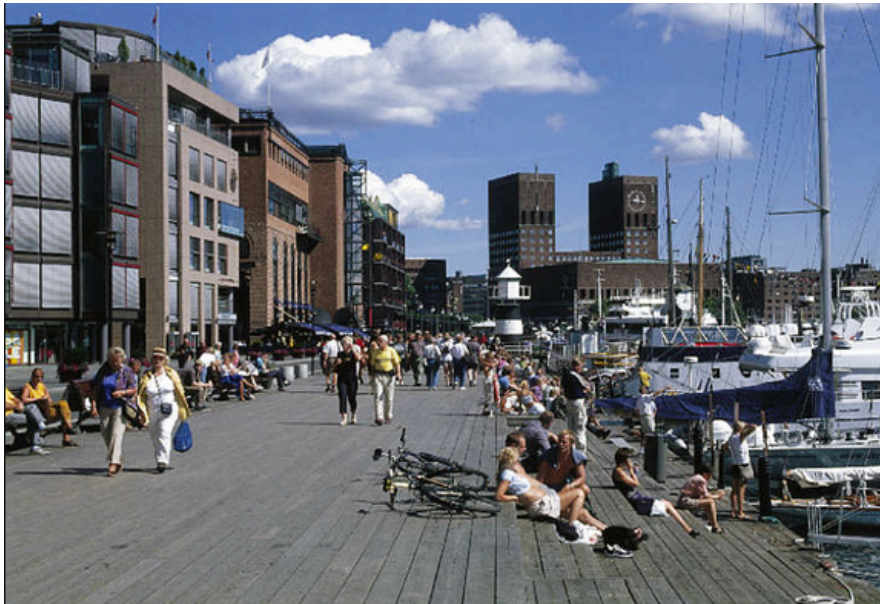
Mereäärne olemine (Oslo) 6