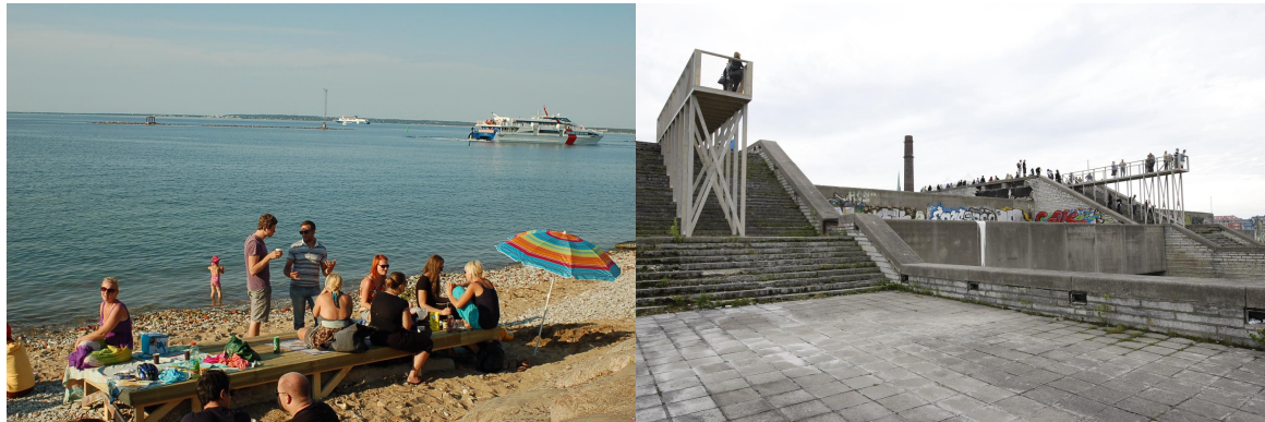
LIFT 11 linnainstallatsioonid Tallinnas 4